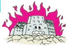
①地震で火災がおこり建物が焼けた